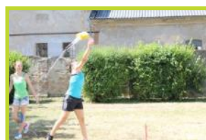
Entspannend: das Freizeitprogramm